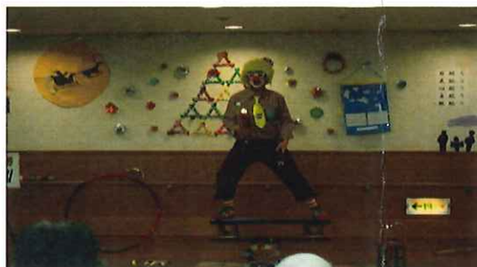
12/13・・・まほろばマジック研究会