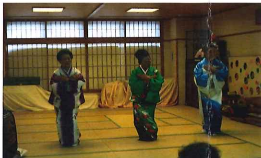
12/17・・・三井流 歌央会

その他にも、三井流 歌祐会、民話茶屋の会 マジックユニットでこぼこが慰問に来てくださり、 楽しい時間を過ごされています。