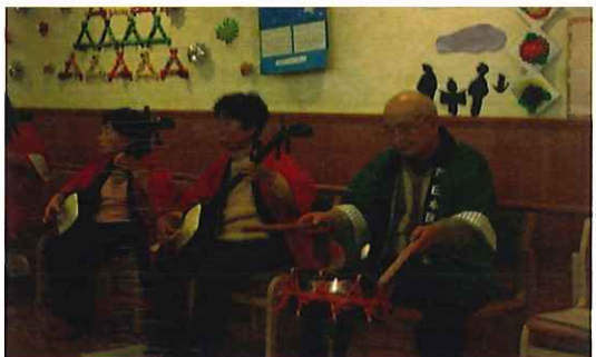
12/14・・・福島こけし会