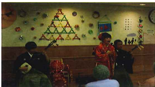
12/1・・・三味線・民謡大道芸