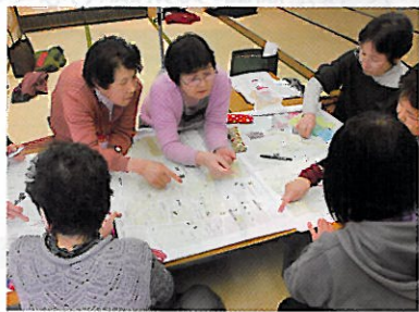
【ささえ合いマップ作り】

●サロンや町内会を単位として住民相互の見守りや助け合い等のネットワーク体制を構築するため、研修会・ニーズ調査等を行います。