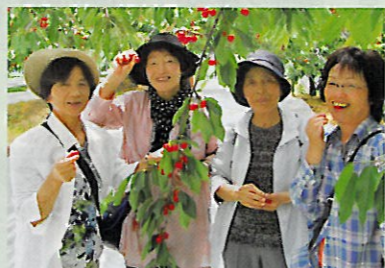
【リフレッシュツアー】