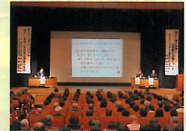
【福島市民生委員・児童委員研修会】