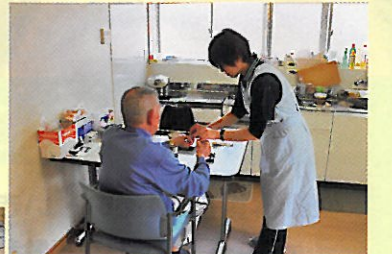
【ホームヘルプサービス】