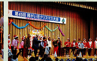
【障がい児クリスマス大会】