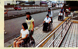
【サマーショートボランティアスクール】