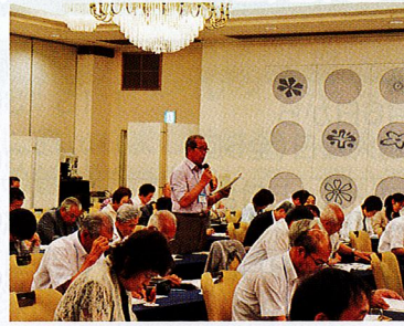
【地域ささえ合い研修会】

●サロンや町内会を単位として住民相互の見守りや助け合い等のネットワーク体制を構築するため、研修会・ニーズ調査等を行います。