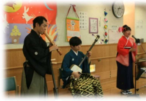
ボランティアによる演奏会